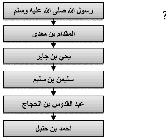
Gambar 2. Skema Sanad