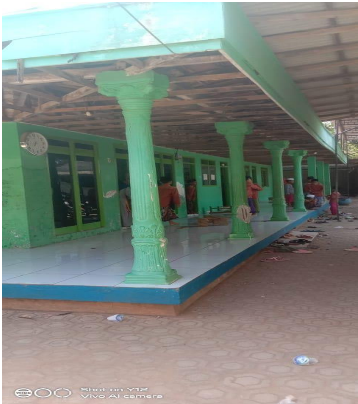
Foto Madrasah Nurul Ulum Assholihyah